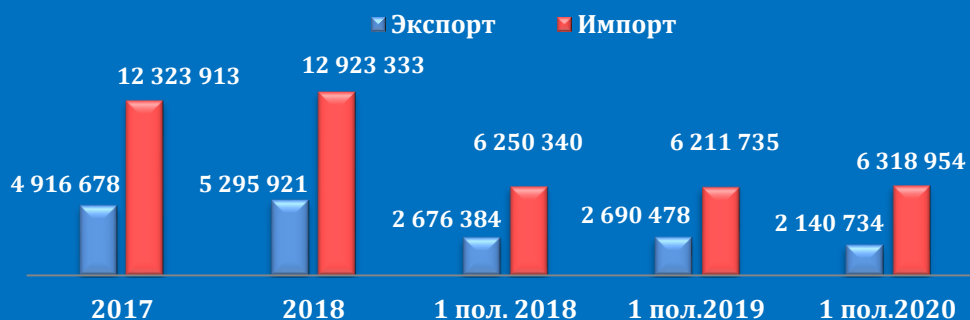
Динамика взаимной торговли Казахстана и России (тыс. $) 2017 - 2018 - 1 пол. 2018 - 1 пол. 2019 - 1 пол. 2020

Торговые отношения между Республикой Казахстан и Российской Федерации носят устойчивый и прочный характер и связаны в основном с развитием сырьевого сектора. Россия является главным торговым партнером Казахстана, объем товарооборота Казахстана с Россией в общем объеме внешней торговли Казахстана составляет 19,1%.